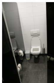
WC beim Restaurant