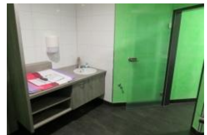
WC beim Restaurant