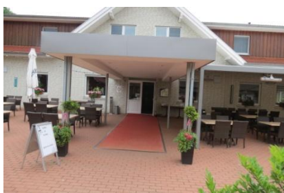
Eingangsbereich zu Hotel/Restaurant